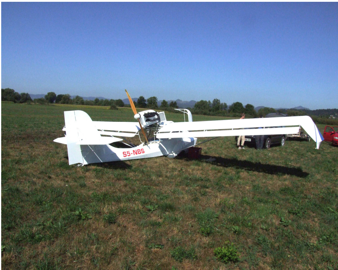
Slika 1. Položaj letala na mestu popolne zaustavitve

Dne 03.09.2011 ob 09.10 uri po lokalnem času je pilot z amatersko izdelanim motornim letalom tipa Avid Amphibian, registrske oznake S5-NBS, vzletel na vzletišču Podpeč z namenom opraviti prvi poskusni let za pridobitev nacionalnega spričevala za letenje. Po predhodno opravljenem preizkusu delovanja motorja na zemlji je pilot vzletel v smeri 260°. Na doseženi višini približno 300 ft nad terenom je prišlo do nenadne odpovedi delovanja motorja. Pilot se je odločil, da bo izvedel zasilni pristanek na bližnjem travniku južno od vzletno pristajalne steze. Pri pristanku na kmetijsko zemljišče je letalo po 25 metrih pristajalne poti z levim kolesom podvozja zadelo v meteorni kanal, ki se je nahajal skoraj povprečno glede na smer pristajanja. Letalo se je rahlo odbilo od tal in zasukalo v levo smer ter v levem blagem nagibu z zaključkom krila za na vodo levega krila zadelo v teren. Po petih metrih od roba kanala se je letalo ustavilo v smeri 040°. Pri dogodku je prišlo do manjših poškodb na levem podvozju, zaključku krila za na vodo na koncu levega krila in manjših poškodb na trupu letala. Pri pristanku se pilot ni poškodoval.