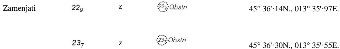
Chart Tržaški zaliv 03 (WGS84)