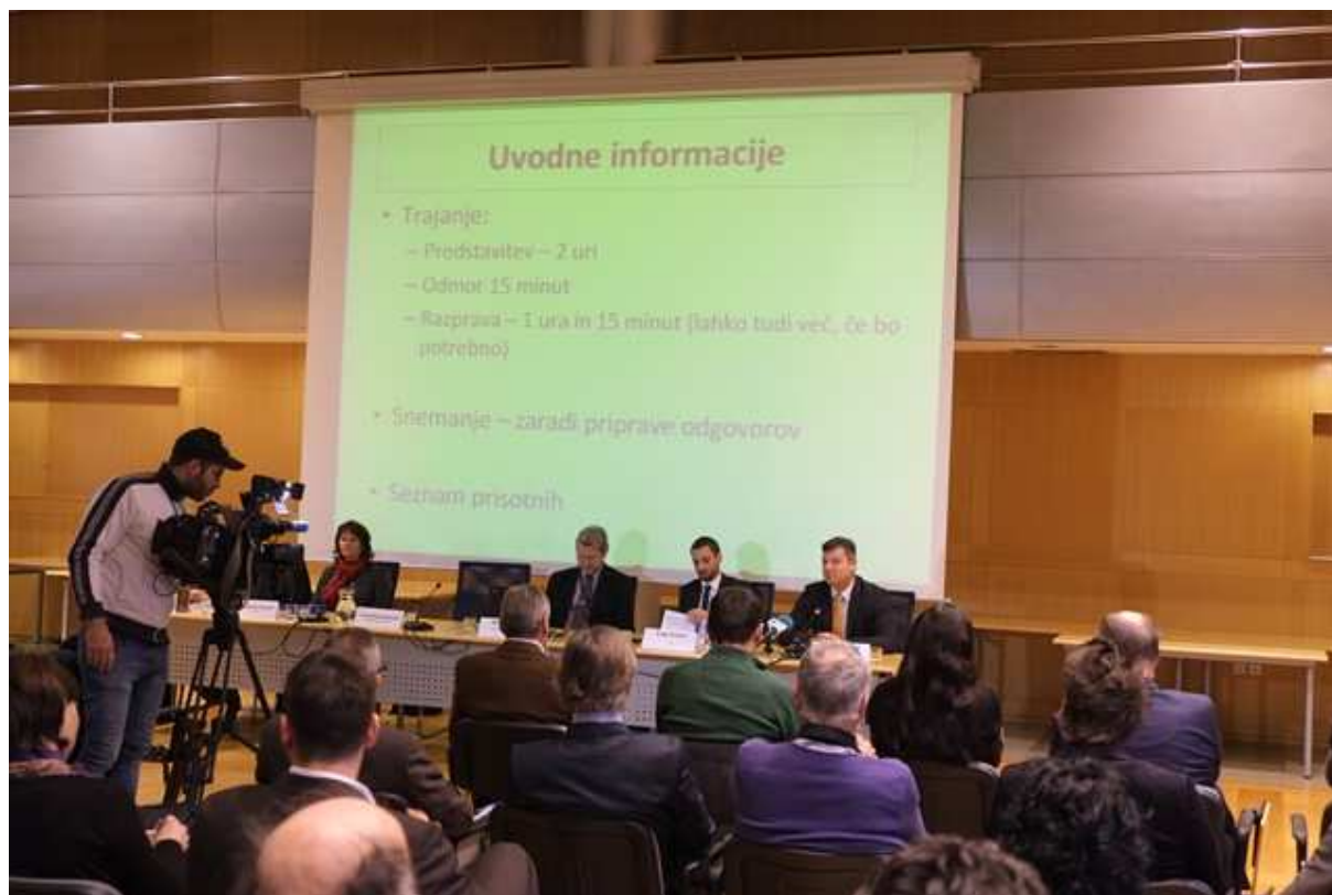
Slika 1: Javna predstavitve Strategije razvoja prometa in Okoljskega poročila

V času javne predstavitve in razprave je bilo pridobljeno večje število pripomb. Te so se nanašala pretežno na Strategijo razvoja prometa, in sicer predvsem na pomanjkljivost podajanja informacij o konkretnih projektih. Pripombe, ki se nanašajo na Okoljsko poročilo so predstavljene v tabeli 1, prav tako je v desnem stolpcu pojasnjen način upoštevanja posamezne pripombe.