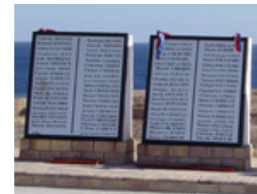
Spominsko obeležje v Sharm el-Sheikhu (januar 2004)