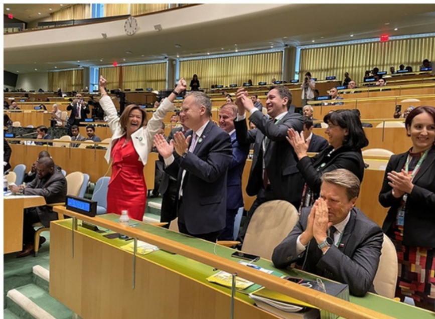
Slovenska delegacija ob izvolitvi v Varnostni svet Združenih narodov