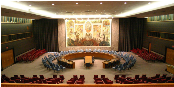
Varnostni svet OZN