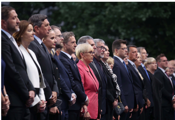
Državna počastitev ob 20. obletnici vstopa Slovenije v EU v Novi Gorici

Posebno poslanico ob obletnici je 1. maja na Slovenke in Slovence doma in po svetu ter vse prebivalce Slovenije naslovila predsednica države Nataša Pirc Musar, v Državnem zboru od začetka leta potekajo številne aktivnosti in dogodki v počastitev obletnice, med drugim so na spletni strani Parlamentarni pogled na 20 let v EU predstavljeni prispevki posameznikov, ki so sooblikovali podobo prvih dveh desetletij članstva Slovenije v Evropski uniji. Osrednji dogodek praznovanja je bila slavnostna seja Odbora za zadeve Evropske unije, ki je potekala v torek, 7. maja 2024, v veliki dvorani Državnega zbora.