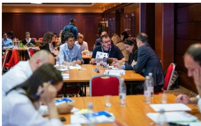
Usposabljanje: "Strengthening Societal Resilience and Countering Disinformation in 6 Western Balkans Countries", Portorož, junij 2023

Projekti s področja strateškega komuniciranja vključujejo usposabljanje in opolnomočenje diplomatov, vladnih komunikatorjev, medijskih organizacij in civilne družbe za komuniciranje v digitalnem informacijskem okolju, boj proti dezinformacijam, krepitev zaupanja med institucijami in državljani ter iskanje inovativnih načinov za izmenjavo znanja z občinstvom.