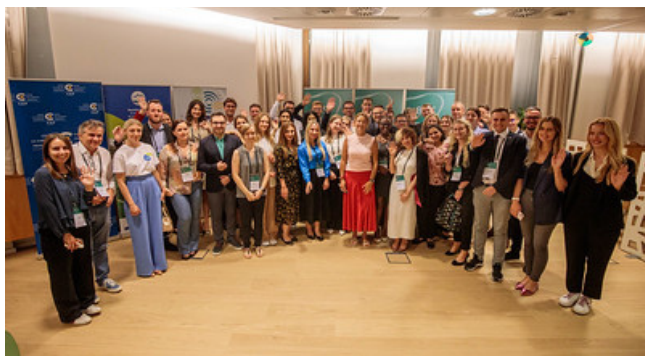
Organizatorji in udeleženci Young BSF 2023 z ministrico Fajon

Letos bo Blejski strateški forum za mlade potekal med 30. avgustom in 1. septembrom na Pokljuki pod naslovom Restoring Common Ground, ki se navezuje na naslov krovnega foruma – Svet vzporednih resničnosti (A World of Parallel Realities). Udeleženci Blejskega strateškega foruma za mlade bodo iskali načine, kako te resničnosti zblížati, da bi lahko ponovno ustvarili prostor za pozitivno družbeno delovanje. Vedno bolj jasno postaja, da je razkorak med mnenji o najboljših pristopih k reševanju družbenih izzivov na najvišji ravni vedno večji, hkrati pa je tudi vedno manj strinjanja, kaj je materialno resnično in kaj politično sprejemljivo na najbolj osnovni ravni. To soglasje nujna skupna podlaga za pozitivno družbeno delovanje in reševanje skupnih izzivov. Danes se zdi, da se naše resničnosti vse manj srečujejo, kar omejuje skupna izhodišča in onemogoča reševanje najbolj perečih izzivov.