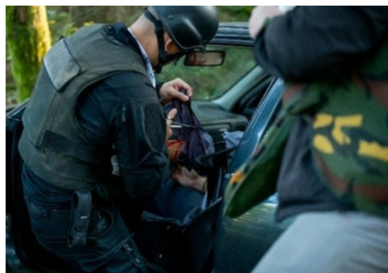
Usposabljanje za napotitve v nevarna okolja v Golenici, 2023

Trenutno se intenzivno ukvarja s projektom digitalizacije v tej regiji in tako prispeva k trdni, varni in odporni Evropi ter močnejšim čezatlantskim zavezništvom.