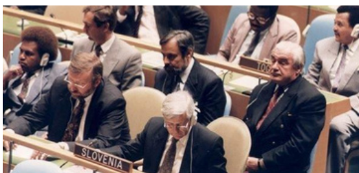
Slovenska delegacija v generalni skupščini OZN na dan včlanitve Slovenije v OZN

V spomin na ta dogodek 22. maja zaznamujemo dan slovenske diplomacije.