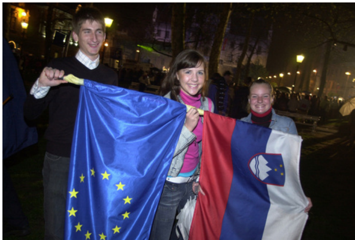
Obeležitev vstopa Slovenije v EU