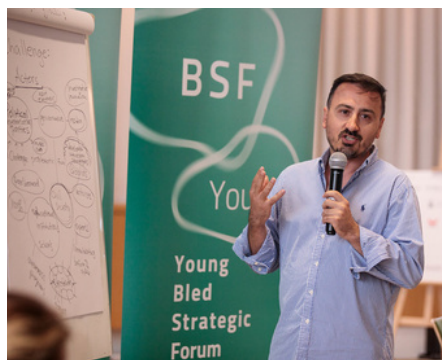
Young BSF 2023

Po podobnem sistemu kot na Blejskem strateškem forumu tudi mladi udeleženci razpravljajo, premišlujejo in iščejo odgovore na pomembna lokalna in globalna vprašanja v pogovoru s svojimi vrstniki ter odločevalci, predstavniki akademske sfere, civilne družbe in podjetji. Vsako leto je v ospredju drug globalni izziv, ki predstavlja osrednjo tematiko dogodka, okoli katerega so oblikovane interaktivne razprave, delavnice, seminarji in simulacije. Teme, zajete pod naslovom konference, so bile v preteklih izvedbah vloga mladih v družbi, izzivi demokracije, trajnostna varnost, vloga zaupanja in druge.