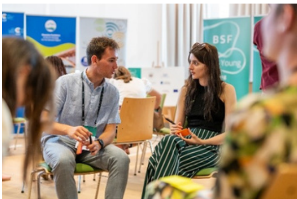
Udeleženci BSF za mlade, 2023

Od svojih začetkov leta 2006 se je ekipa CEP, ki je takrat štela le nekaj predanih posameznikov, do danes razširila na dvajset zaposlenih, ki izvajajo raznovrstne projekte in dejavnosti v okviru štirih tematskih stebrov: Blejski strateški forum, mir in varnost, regionalno sodelovanje in strateško komuniciranje.