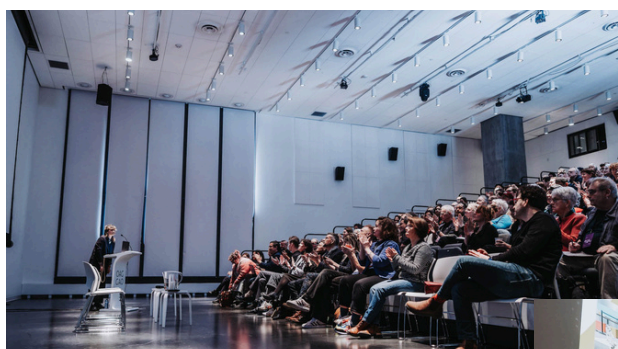
Utrinki s simpozija