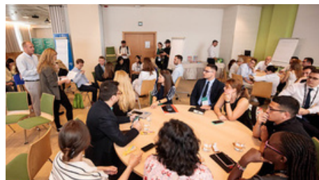
Young BSF 2023

Glavno poslanstvo Blejskega strateškega foruma, vodilne mednarodne konference v Srednji in Jugovzhodni Evropi, je izmenjava mnenj in iskanje idej za premagovanje sedanjih in prihodnjih izzivov. Da je aktivna vključitev mladih ključna za doseganje ciljev konference, so organizatorji, Ministrstvo za zunanje zadeve Slovenije in Center za evropsko prihodnost, prepoznali že pred 14 leti, ko je bil prvič izveden Blejski strateški forum za mlade (Young Bled Strategic Forum).