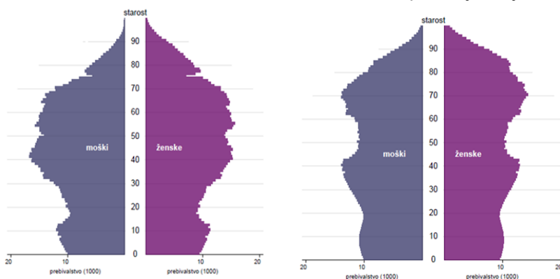
Slika 1: Piramida prebivalstva Slovenije, 1. julij 2021 Slika 2: Projekcija piramide prebivalstva Slovenije 2051

Demenca spada med prednostne naloge javnega zdravstva tako v svetu kot pri nas. Za demenco zbolijo tudi osebe, mlajše od 65 let, kar predstavlja 9 % primerov demenc, 8 zaradi staranja prebivalstva hitro narašča število oseb z demenco (izrazito hitro povečevanje je opazno v starostni skupini nad 80 let) 9 . Demografske spremembe so odsev razvoja v sodobni družbi in so dejstvo, ki mu je treba prilagoditi zdajšnje sisteme in ureditve ter tako ustvariti možnosti za kakovostno življenje in dostojno staranje vseh generacij. S staranjem se povečuje tudi breme bolezni in se krepijo potrebe po dolgotrajni oskrbi. Pomembno je, da je Slovenija sprejela ZDOsk, ki to področje ureja sistemsko.