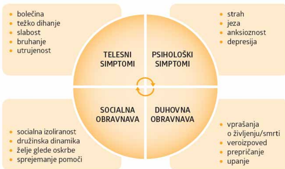
Slika 2: Celostna obravnava (1)

Celostna (holistična) obravnava zajema oskrbo telesnih, psiholoških, socialnih in duhovnih potreb (slika 2).