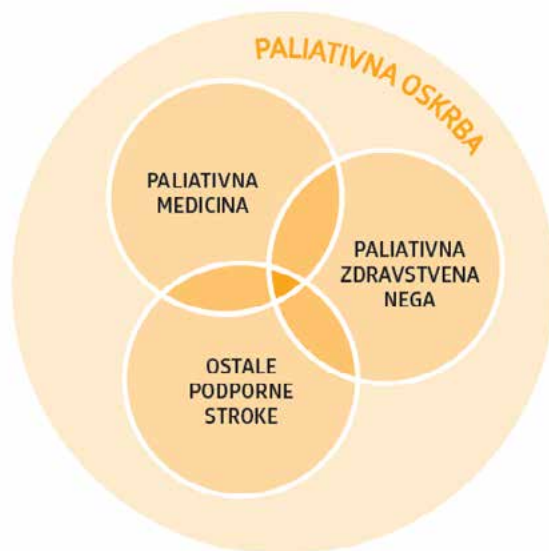
Slika 1: Paliativna oskrba vključuje paliativno medicino, paliativno zdravstveno nego in ostale podporne stroke (z dovoljenjem povzeto po 1)

Celostna (holistična) obravnava zajema oskrbo telesnih, psiholoških, socialnih in duhovnih potreb (slika 2).