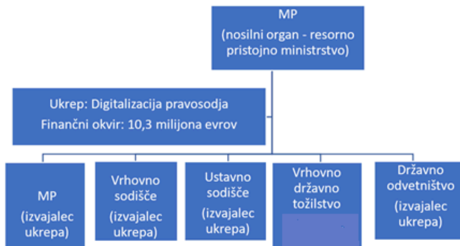
Shema 1: Udeleženci na ukrepu Digitalizacija

Pri izvedbi projektov Zelena sejna soba in Virtualni pomočnik sodeluje tudi VDT, na podlagi upoštevanja določb 158. člena Zakona o državnem tožilstvu, pa je IU MP.