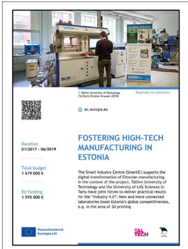
Primer postavitve plakata: