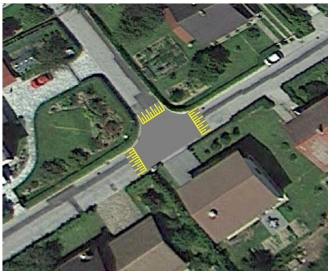
Slika 2: Predlagana rešitev umirjanja prometa na Vrtni ulici v Gornji Radgoni

Občina Gornja Radgona je leta 2014 pridobila strokovno mnenje o ureditvi križišča na Vrtni ulici v mestu, kjer je bilo ugotovljeno, da je križišče prometno nevarno, predvsem zaradi nepreglednosti. Podan je bil predlog, da se izvede ukrep za umirjanje prometa na vseh treh krakih križišča in sicer izvedba križišča na dvignjeni ploščadi. S tem ukrepom se bo povečala zaznavnost križišča in zmanjšala hitrost na vseh priključnih krakih, kar bo poleg prometnih ogledal dodatno povečalo varnost na križišču, tudi za pešce, ki uporabljajo obe cesti za dostope do svojih objektov.