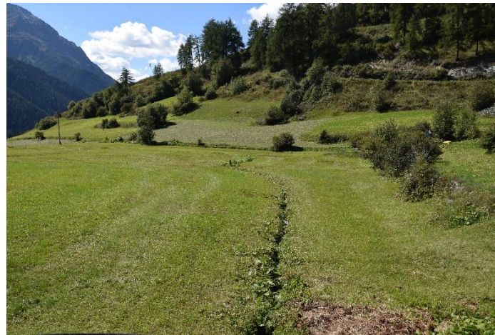
Šotišče - del pilotnega območja z odvodnim drenažnim kanalom

Rešitev: Dosežen dogovor z relevantnimi deležniki - lokalne skupnosti, kmetje, lastniki zemlje in nevladne organizacije, ter projekt in kontrola nad izvedbo.