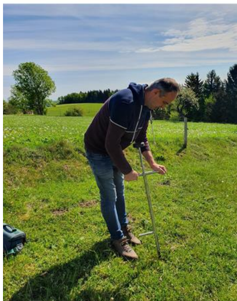
Meritev vlage v tleh in spremljanje vegetacije na terenu

Zakonodaja, ukrepi vezano na sušo: Zakon o odpravi posledic naravnih nesreč; Ukrep 4.1 (SKP)