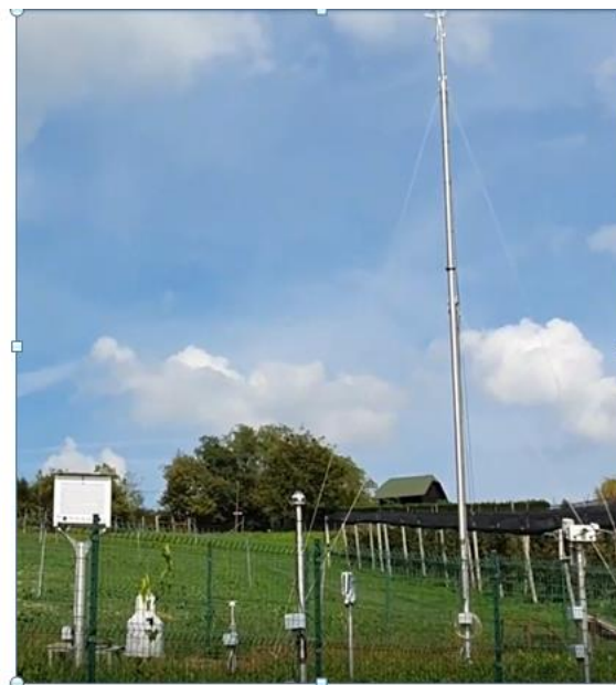
Satelitski in meteorološki podatki o stanju vode v tleh - Meteorološka postaja (ARSO)