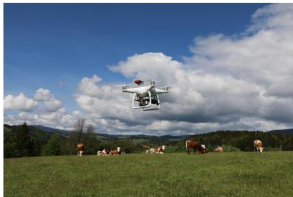
Spremljanje razvoja vegetacije z dronom