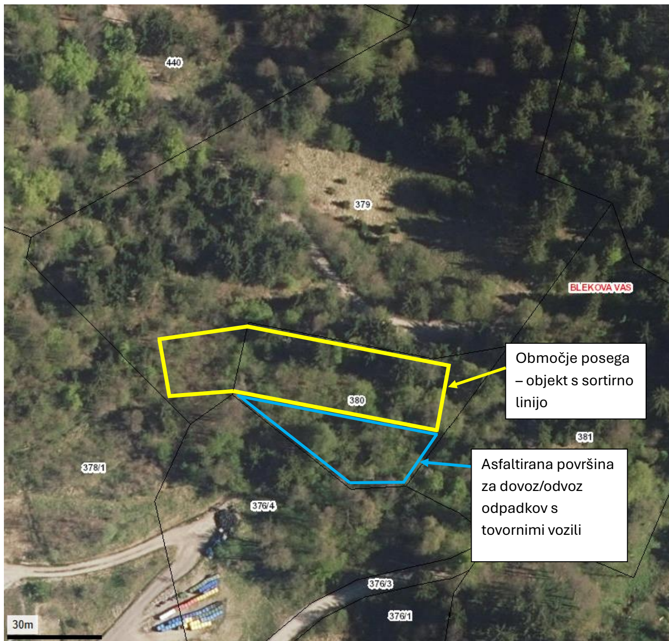
Slika 1: Skica ožjega območja posega gradnje objekta in postavitve avtomatske sortirne linije za nenevarne odpadke na zemljišču s parcelnima številka 380 in 379, k.o. 2016 Blekova vas v merilu 1:000.