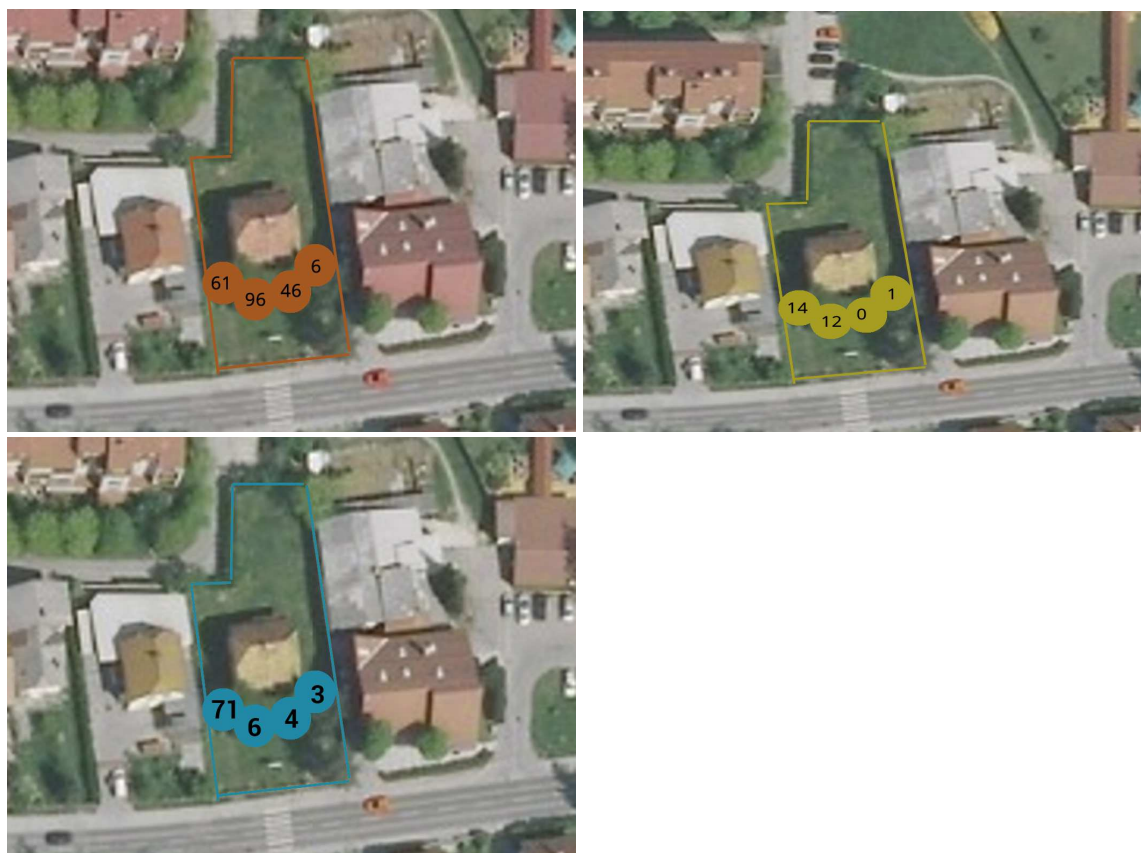
Slika 1. Število odstranjenih rastlin orjaškega dežena ( Heracleum mantegazzianum ) na posameznih žariščih v Novih Fužinah v letu 2016 (levo zgoraj), 2017 (desno zgoraj) in 2018 (levo spodaj).

Uspevanje orjaškega dežena na lokaciji v Novih Fužinah XX XXXXXX k.o. Moste, je bilo ugotovljeno na začetku julija 2015, ko sta podatek o pojavljanju te rastline po medijskih objavah Zavodu Symbiosis sporočila dva občana. Prve aktivnosti za odstranjevanje so stekle že v letu 2015 in se nadaljevale v letih 2016 in 2017. Letos so lastniki parcelo sredi junija pokosili, tako da smo odstranjevanje odložili do začetka julija. Dne 4. julija 2018 smo na parceli odstranili 89 rastlin. Rastline smo odstranjevali mehansko, z izkopavanjem z ostro lopato. Kadar izkopljemo večji del korenine, se rastlina ne obraste več. Orjaškega dežena je bilo precej več kot v preteklem letu, ko smo skupno odstranili 27 rastlin. Morda je to posledica pogostih padavin v poletnih mesecih, zaradi katerih so bile razmere ugodnejše za kalitev semen, ki so še prisotna v semenski banki. Podobno smo namreč opazili tudi na drugi lokaciji v Ljubljani, kjer se je orjaški dežen letos po petih letih ponovno pojavil. Parcelo v Novih Fužinah smo drugič pregledali 30. 7. 2018. Ponovno je odgnalo 11 rastlin, ki smo jih odstranili.