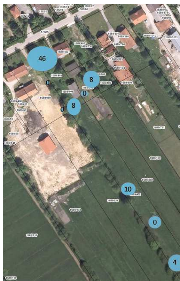
Slika 3. Število odstranjenih rastlin orjaškega dežena ( Heracleum mantegazzianum ) na posameznih žariščih v Črni vasi v letu 2016 (levo zgoraj), 2017 (desno zgoraj) in 2018 (levo spodaj).