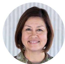
višja štabna praporščakinja JOANNE BASS

Srečanja se je udeležilo več kot 30 glavnih podčastnikov zračnih sil oboroženih sil zavezništva in partnerskih držav.