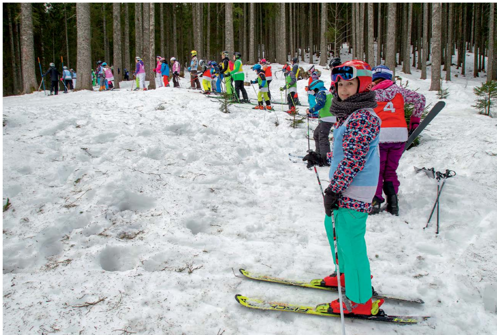
UDELEŽENCI OTROŠKEGA TABORA SO NESTRPNO ČAKALI NA ZAČETEK SMUČARSKE TEKME.

Poleg pripadnikov iz Odseka za celostno skrb za pripadnike iz Sektorja za kadre