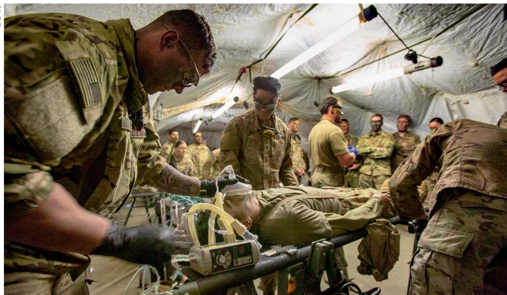
OSKRBA RANJENCA V AMERIŠKI POLJSKI BOLNIŠNICI

vojske. Največ pripadnikov je bilo iz Logistične brigade SV, in sicer iz 670. logističnega polka, 157. logističnega polka in Vojaške zdravstvene enote. Vaja je predstavljala izpopolnitev dosedanjega skupnega sodelovanja med SV in 173. zračnodesantno brigado