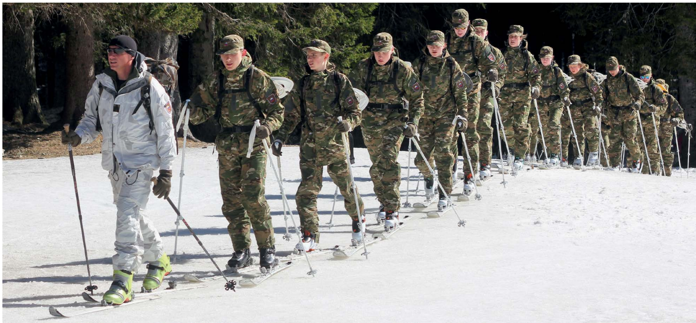
UDELEŽENCI TABORA SO SE NAUČILI PREMIKANJA S TURNIMI SMUČMI IN KRPLJAMI.