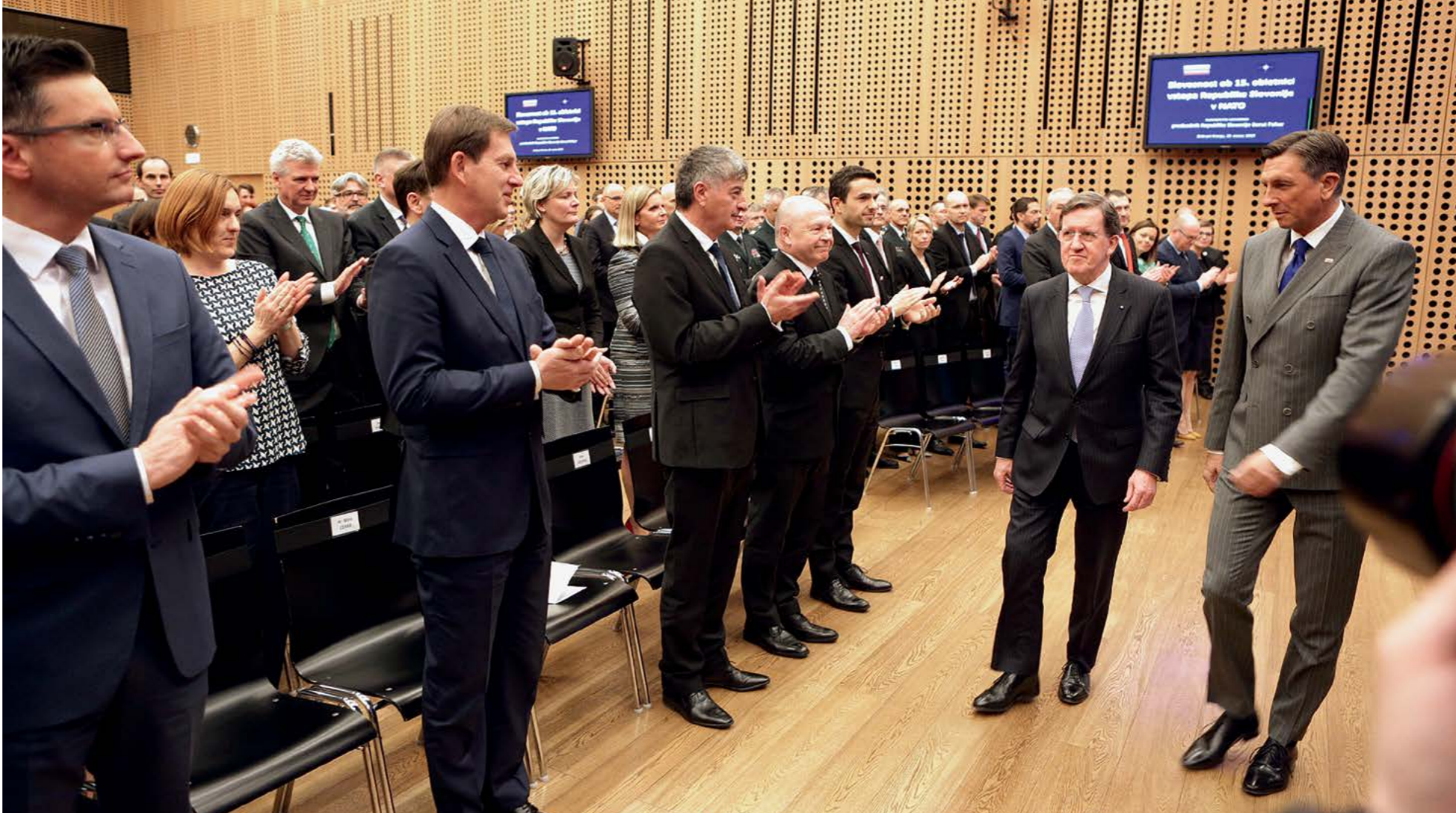
PRIHOD NEKDANJEGA NATOVEGA GENERALNEGA SEKRETARJA LORDA GEORGEA ROBERTSONA