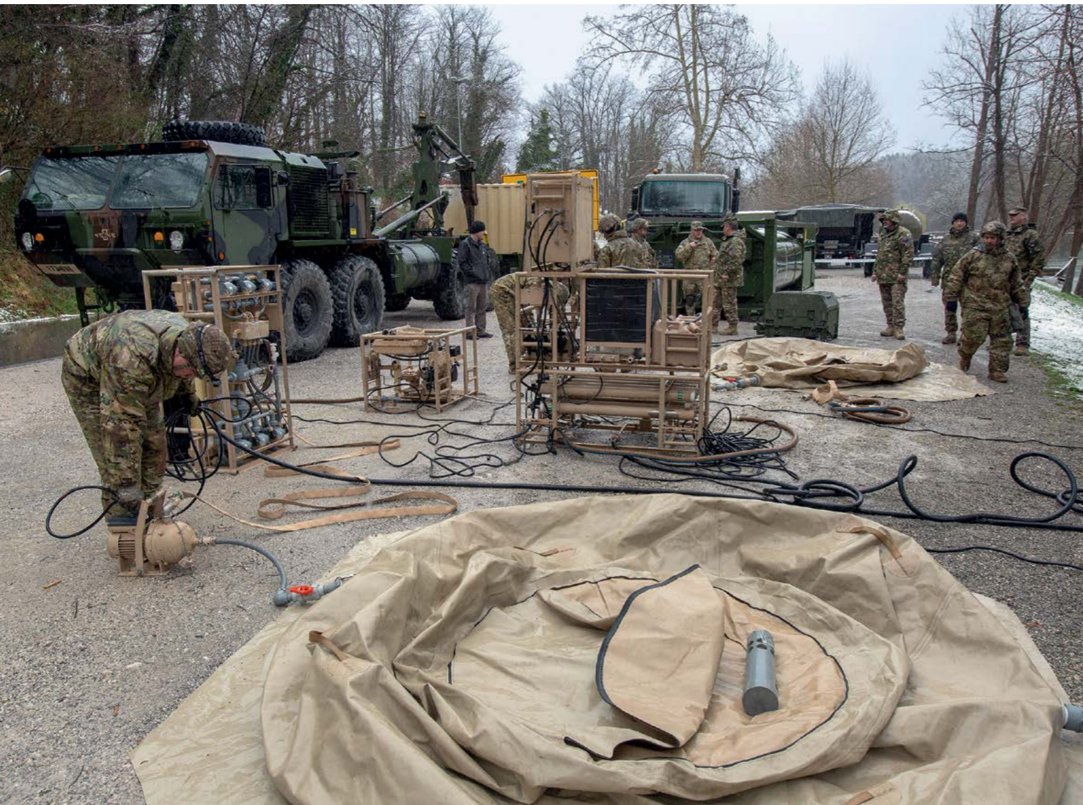
PRIPADNIKI AMERIŠKE VOJSKE SO PREDSTAVILI OPREMO ZA PREČIŠČEVANJE VODE.

Vaja Lipicanec V se je prepletala s kar dvema vajama, ki jih je Slovenska vojska izvajala v sodelovanju s pripadniki oboroženih sil ZDA, in sicer s predhodno skupno vadbeno aktivnostjo MORTEP, nadaljuje pa se z ameriško-slovensko vajo, ki obsega taktično urjenje postopkov pri izvedbi zračnega desanta in taktične vaje z bojnimi streljanji vodov.