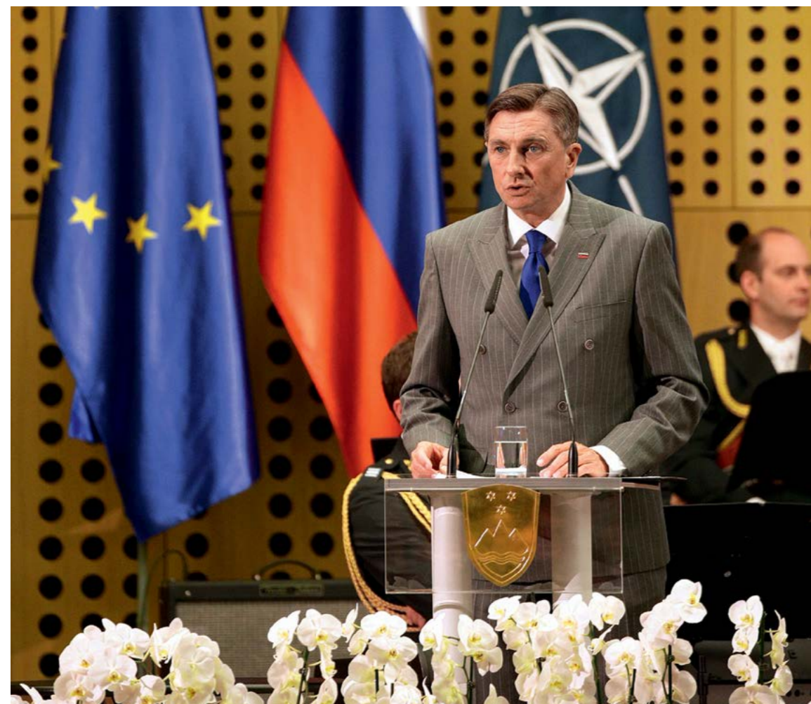
PRESEDNIK PAHOR JE IZPOSTAVIL, DA NATO ŽE 70 LET OD USTANOVITVE ZAGOTAVLJA VISOKO RAVEN KOLEKTIVNE VARNOSTI DRŽAV ČLANIC.

držav, v katerih je Slovenska vojska delovala. Vse to je bistveno pripomoglo k ugledu Slovenije v mednarodni skupnosti. Poudaril je še, da ima Nato enako močne razloge za nadaljnji uspeh, kot jih je imel za svoj nastanek.