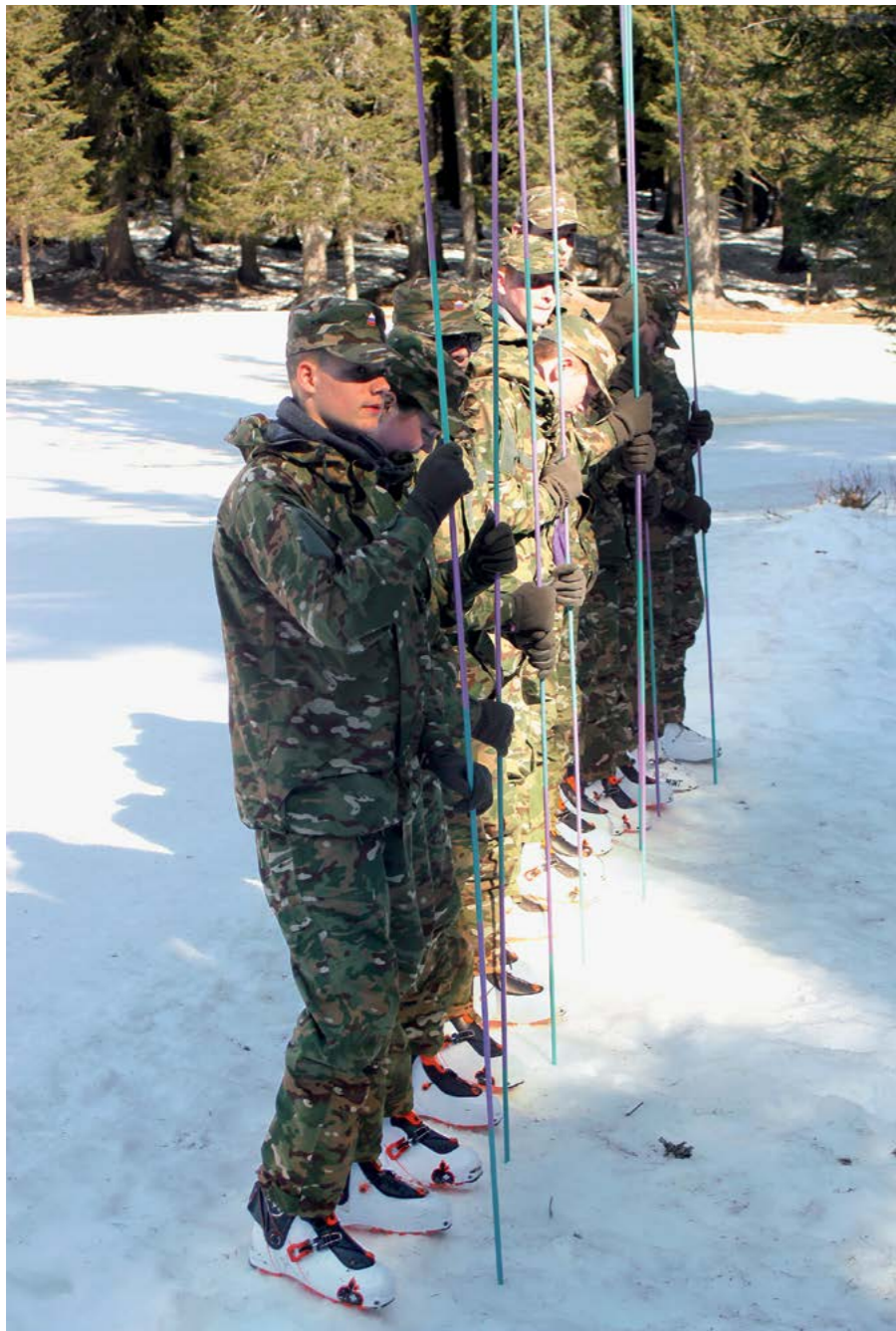
ISKANJE PONESREČENCA POD PLAZOM Z UPORABO TEHNIKE SONDIRANJA