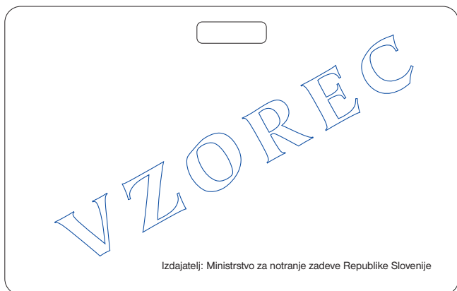
hrbna stran službenih izkaznic pod zap. številko 1