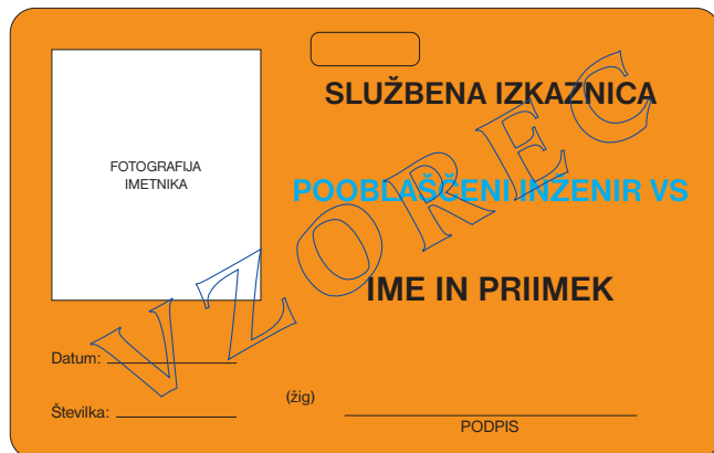
prednja stran službene izkaznice