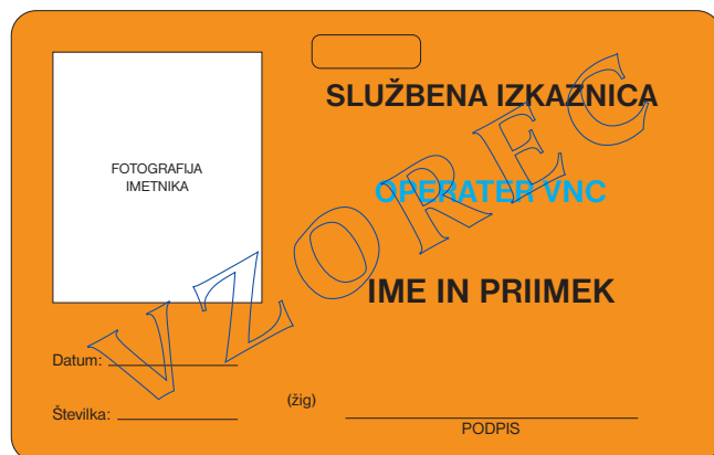
prednja stran službene izkaznice