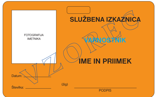
prednja stran službene izkaznice