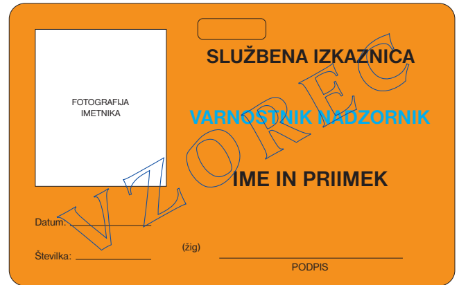
prednja stran službene izkaznice