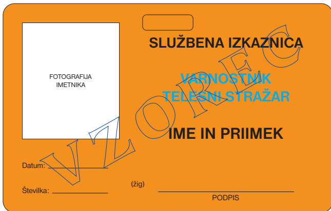
prednja stran službene izkaznice