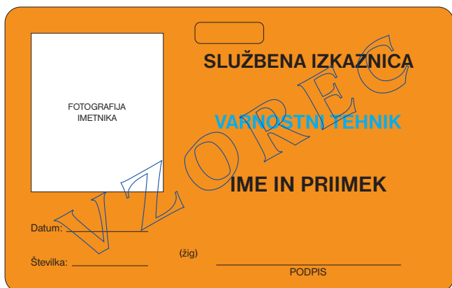
prednja stran službene izkaznice