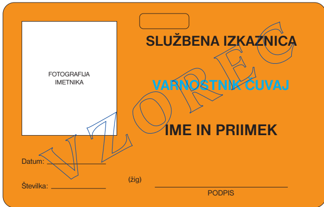
prednja stran službene izkaznice