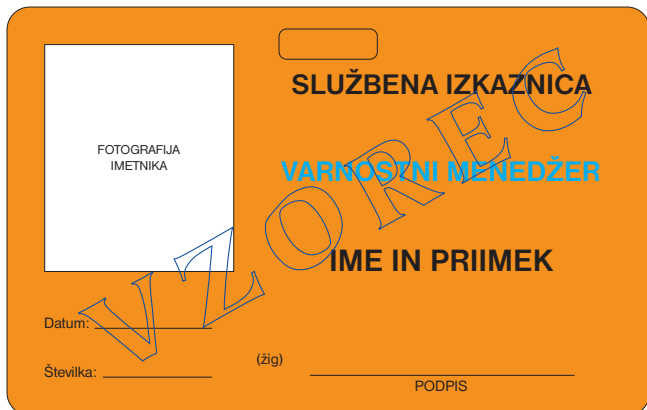
prednja stran službene izkaznice