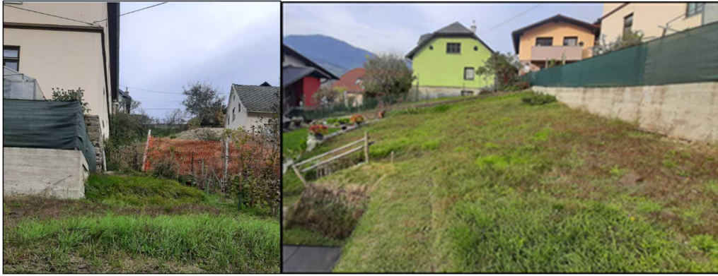
Parcela 829 905/22, severni del parcele Parcela 829 905/22, južni del parcele