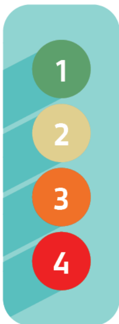
Slika 2: Semafor, ki prikazuje luči skladno s štirimi načeli krožnega gospodarjenja s prostorom.