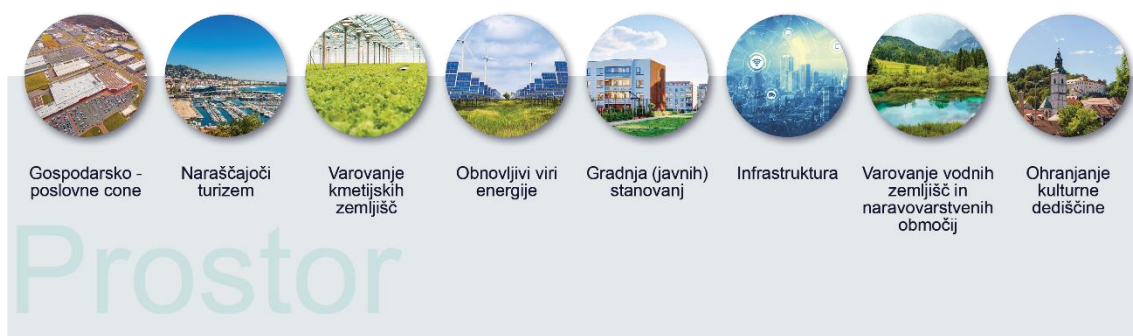
Slika 1: Pritiski na prostor.

Vse človekove aktivnosti za svoje delovanje potrebujejo prostor, ki pa je absolutno omejen, zaradi česar se stalno vršijo pritiski nanj: gospodarstvo, zlasti kmetijske in proizvodne dejavnosti ter tudi nekatere storitvene, kot sta trgovina in turizem, za svoje delovanje potrebujejo obsežne površine; dobra mobilnost ljudi in blaga je zahtevani standard današnjega časa in potrebe po ustrezni infrastrukturi za ta namen so velike; za zeleni prehod bomo morali vlagati v obnovljive vire energije; na stanovanjskem področju so ambicije po gradnji novih stanovanj (in javnih stanovanj) z ustrezno infrastrukturo velike. Obenem pa so varovanje naravnih ekosistemov, voda, kmetijskih zemljišč in gozdov vedno bolj pomembne družbene vrednote. Vse navedeno predstavlja konflikte interesov v prostoru, zato je tako imenovano krožno gospodarjenje s prostorom edini možni odziv na dano situacijo.