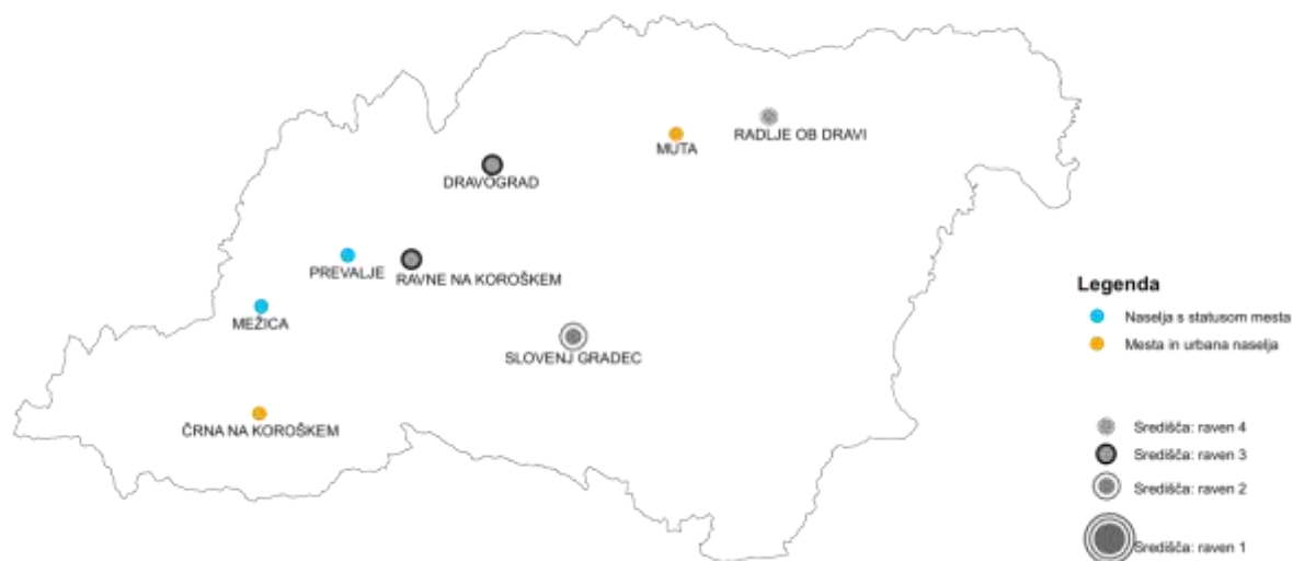
Slika 1: Prikaz urbanih naselij in središč policentričnega urbanega sistema na območju Koroške razvojne regije (vir: MOP DzPGS, Kartografska podlaga: GURS, Obdelava: MOP, DzPGS)

Radlje ob Dravi se razvijajo kot središča IV. ravni. V središču se zagotavlja najmanj zdravniška oskrba na primarni ravni in teritorialna organizacija državne uprave.