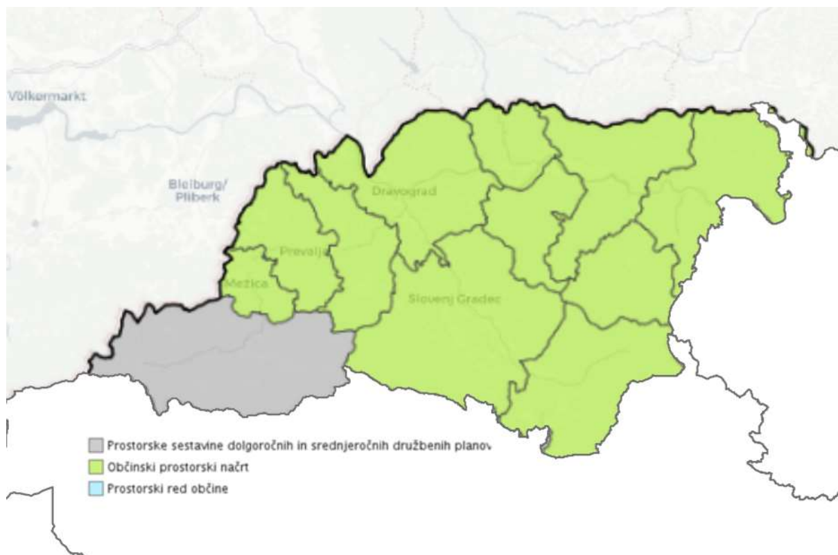
Slika 4: Veljavni občinski prostorski akti v Koroški regiji. ( vir: MOP, DzPGS, http://storitve.pis.gov.si/pis-jv/informativni_vpogled.html )

Na podlagi podatkov Ministrstva za okolje in prostor, so imele v Koroški regiji občinske prostorske načrte sprejete vse občine, razen občine Črna na Koroškem. V fazi priprave občinskega prostorskega načrta je bila na dan 31. 12. 2018 občina Črna na Koroškem.