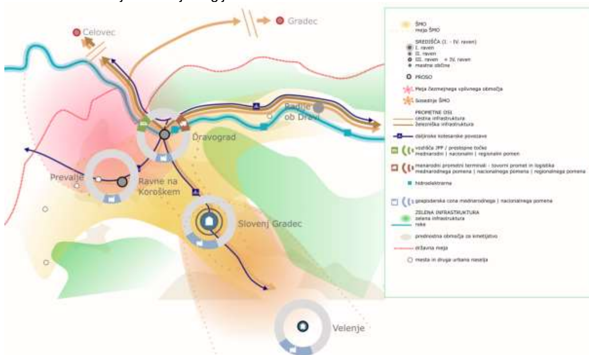
Slika 2: Koroško širše mestno območje

Proti jugu se Koroško širše mestno območje funkcionalno povezuje z Velenjem kot središčem v Savinjski razvojni regiji.