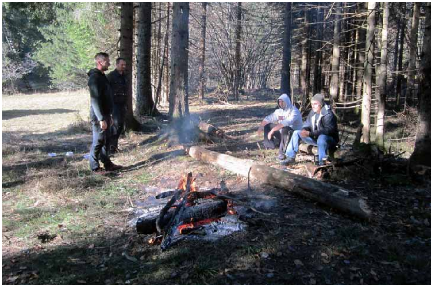
Usposabljanje v Gotenici: preizkus na terenu

Redno zaposlene naravovarstvene nadzornike ima večina uprav naravnih parkov in rezervatov, trenutno jih je 51. Ponekod sodelujejo tudi prostovoljni nadzorniki – teh je 42.