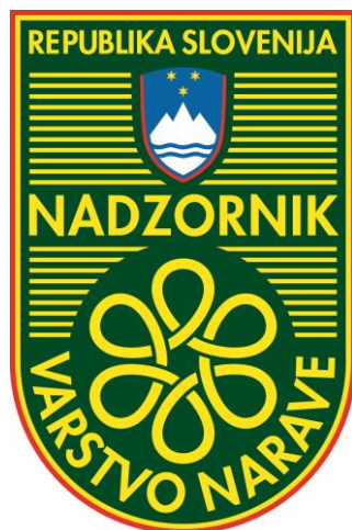
Simbol varstva narave