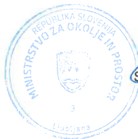
Simon Zajc minister