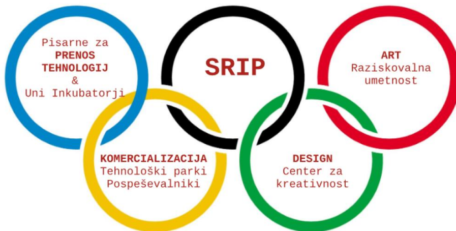
Slika 3: Shema inovacijskega podpornega okolja