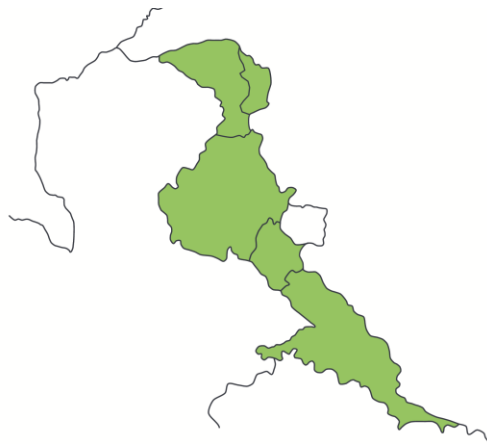
Slika 1: Programsko območje

Programsko območje, opredeljeno po posameznih občinah in njihovih naseljih, kjer imajo upravičenci pravico do izvajanja projektov: