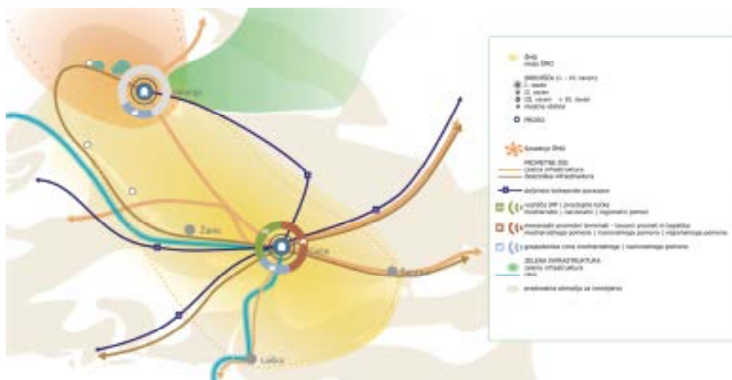
Slika 2: Savinjsko širše mestno območje, (Vir: MOP, Savinjska regija, Usmeritve za pripravo strategije razvoja regije s področja prostorskega in urbanega razvoja, 2021)

Geografska lega in zgodovinske okoliščine zaznamujejo Slovenijo kot prometno živahno prehodno območje in križišče dveh največjih vseevropskih koridorjev – V. in X., kot sta bila določena na konferenci ministrov za promet na Kreti 1994 in v Helsinkih leta 1997. Skozi Savinjsko regijo potekajo V. koridor in tovorna koridorja 5 in 6.