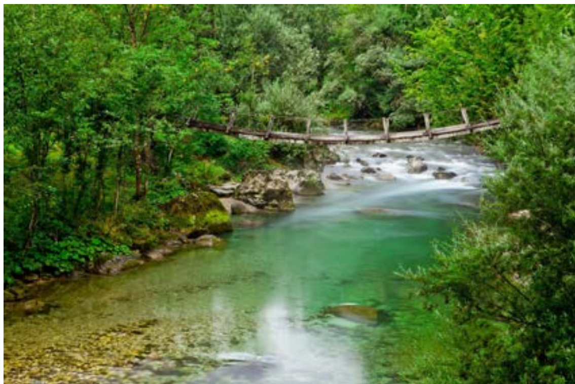
Tabela 34: Kazalniki za Ukrep 2.8 – Spodbujanje trajnostne večmodalne mobilnosti