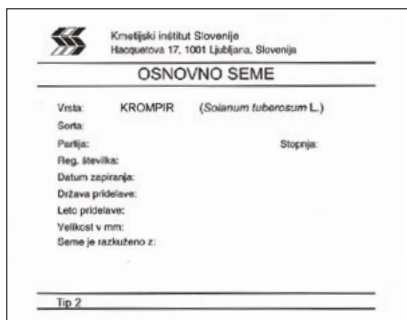
Slika: osnovno seme

je vrstno pristno seme nekaterih poljščin (npr. ajda, proso, panonska grašica, navadna turška detelja), pri katerih sorte še niso bile vzgojene ali požlahtnjene ali pa je teh sort malo.