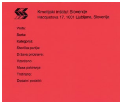
Slika: certificirano seme II. generacije