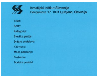
Slika: certificirano seme I. generacije