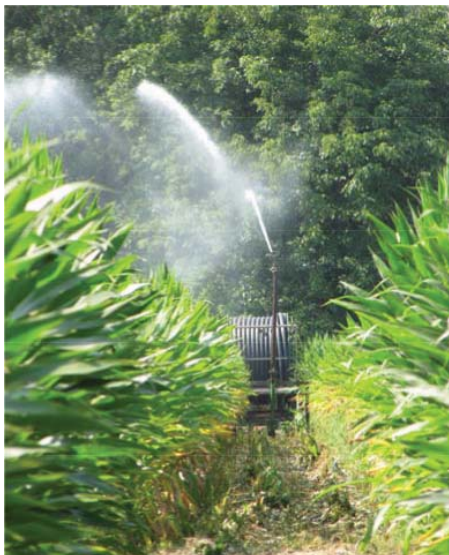
Slika 4: Namakanje koruze pred metičenjem

gaženja tal in izpiranja hranil. Če želimo s cisterno namočiti tla z 20 \text{ l/m}^2 , je treba 10 \text{ m}^3 veliko cisterno z vodo napolniti in izprazniti kar 20-krat, da namočimo 1 ha. Namakanje s cisterno je lahko le intervencijsko, ko želimo dodati manjše količine vode za hlajenje rastlin in povečanje relativne vlažnosti zraka v posevku koruze. Za uspešno oprашitev rastlin lahko tako namakanje zadošča, saj pogosto oprășitev prepreči suh in vroč zrak, in ne pomanjkanje talne vlage.