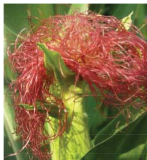
Slika 1: Svilanje koruze

Koruza je poljščina, ki potrebuje za optimalni razvoj precej vode. Za pridelek 10 ton zrnja na hektar porabi koruza najmanj 7.000 ton vode (700 l/m 2 ), pri čemer nista upoštevani izhlapevanje in odcedna voda.