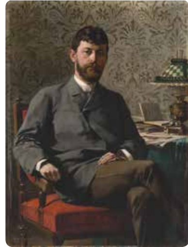
Jurij Šubic: Dr. Ivan Tavčar, 1885, olje na platnu, 137 cm x 101 cm

Ivan Tavčar se življenja je zavedal, kakor se je zavedal dejstva, da slovenska književnost ima svoj vpliv in učinek. Kajti zakaj bi se mu sicer zdelo smiselno njenim odjemalcem, (izobraženim) slovenskim bralcem, v sklepu in obenem vrhuncu »labodjega speva« še sporočiti, naj v zakonskih zvezah rojevajo otroke, »ki bodo pomnožili slovensko vojsko in armado slovenskih delavcev!«