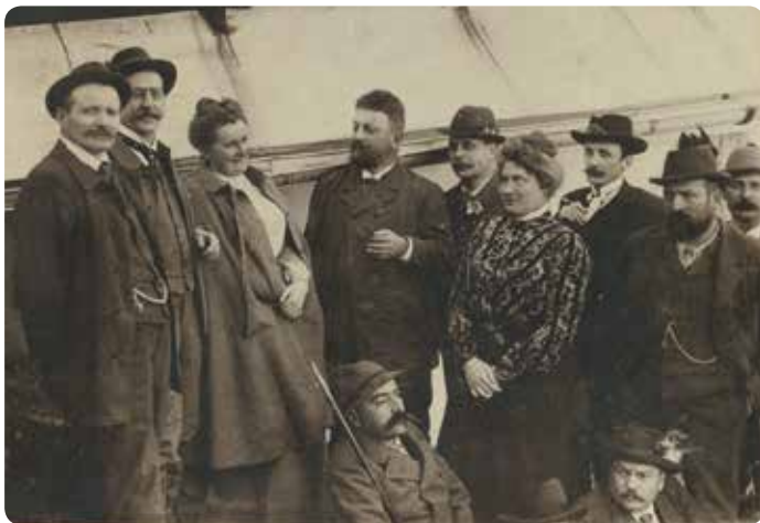
Ivan Tavčar s prijatelji

Vsestransko dejaven mož širokih obzorij je bil Ivan Tavčar. Zato naj bo jubilejno leto spodbuda za nove in tehtne, drugačne in pomalem drzne, temeljite in ustvarjalne premisleke o vsem tistem, kar je napolnjevalo njegovo življenje in do danes s svojim sporočilom napolnjuje tudi nas!