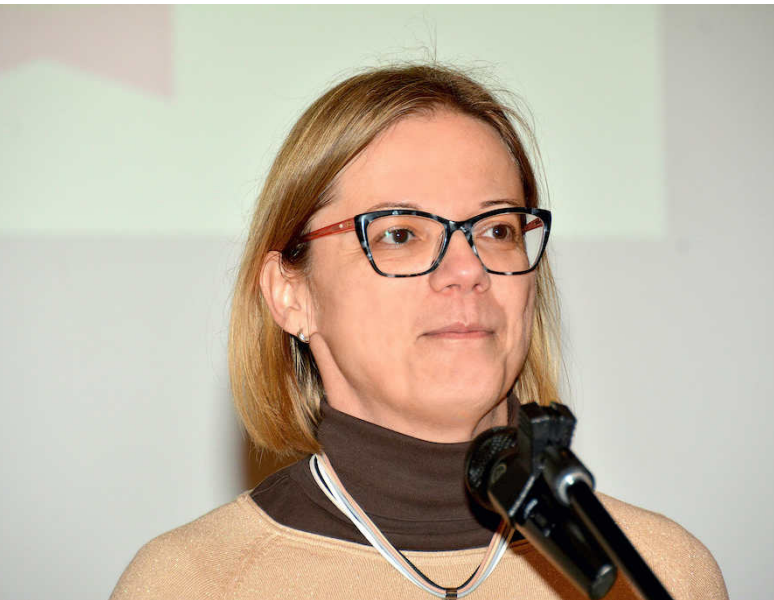
Ministrica za javno upravo Sanja Ajanović Hovnik