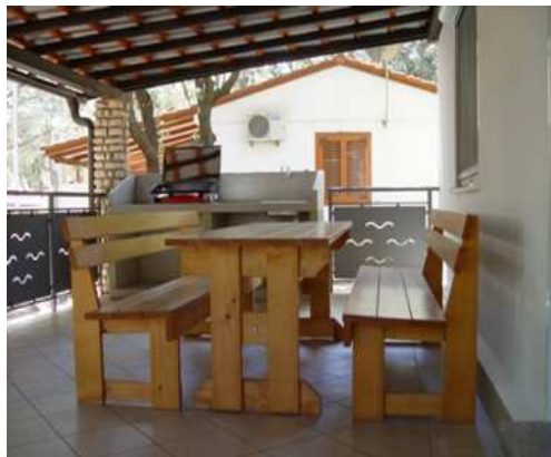
letna kuhinja – hiša 562