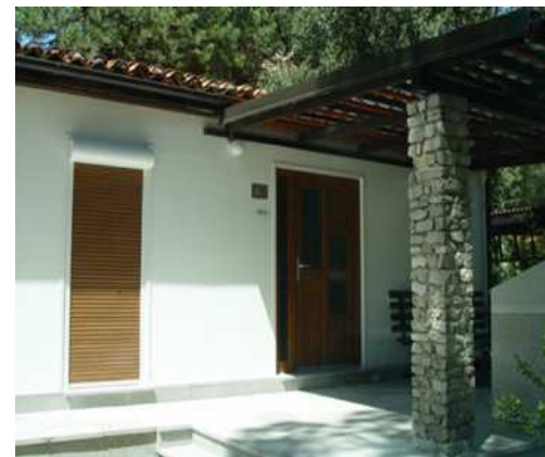
terasa – hiša 103