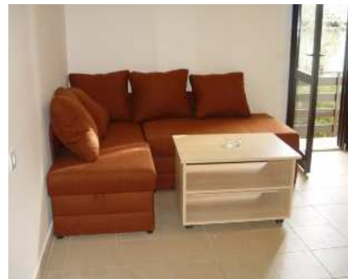
dnevno bivalni prostor