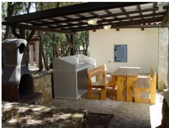
letna kuhinja – hiša 715