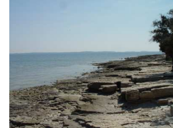
plaža v Barbarigi

Fotografije pritličnega apartmaja (36004 in 32015):