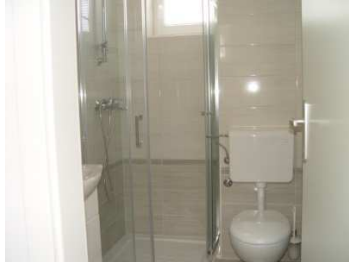
WC s kopalnico