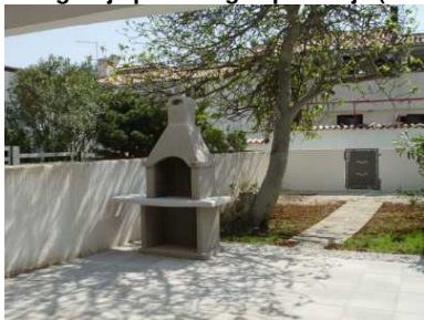
Terasa – apartma 36004

Fotografije pritličnega apartmaja (36004 in 32015):