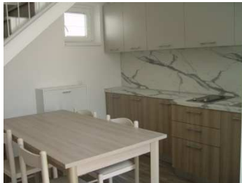
kuhinja z bivalnim prostorom