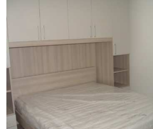
spalnica v nadstropju