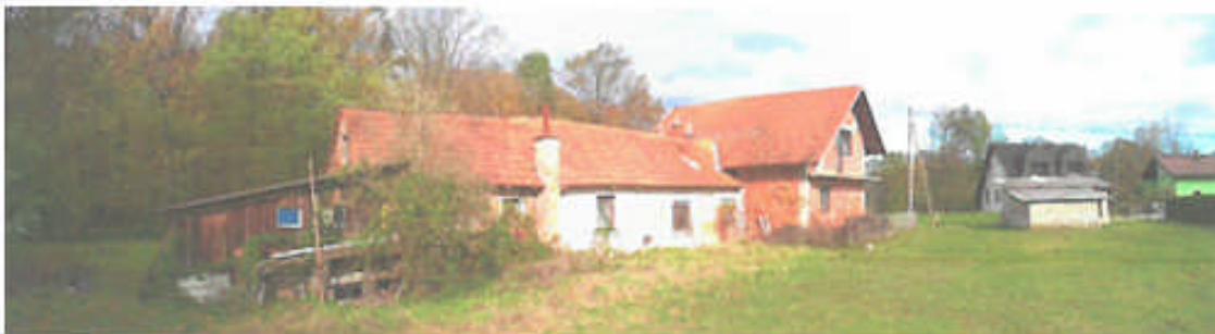
nepremičnina s parc. št. 474/20 k.o. 244 - Lukavci