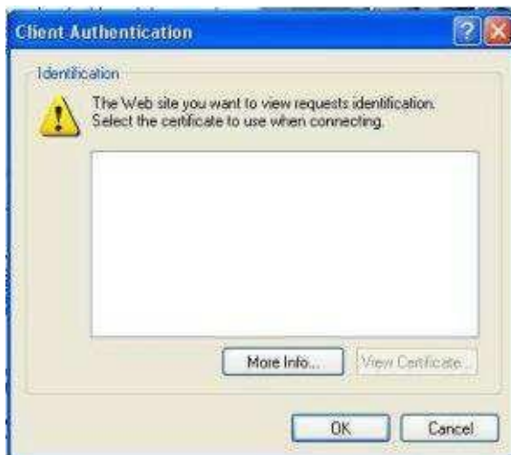
Slika 3: Opozorilno okno

Aplikacija, ki je nameščena na Ministrstvu za javno upravo, je dostopna le s kvalificiranim spletnim potrdilom, ki je lahko izdano s strani overovateljev SIGEN-CA, SIGOV-CA, AC-NLB, POSTA-CA ali HALCOM. V primeru, da na računalniku uporabnik nima nobenega spletnega potrdila, se pri prijavi pojavi naslednje okno: