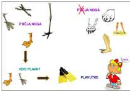
Slika 1: Primer pojmovne mape

Obravnavane teme, če je le mogoče, povežemo z njegovimi življenjskimi izkušnjami, saj tako problem lažje zaznava in se lažje uči. Učimo uporabna znanja v naravnih povezavah, s poudarkom na funkcionalnih ciljih in pojmovnih mapah. Vsako novo temo povežemo z že obravnavano. Tako informacije lažje povežejo in strukturirajo podatke.