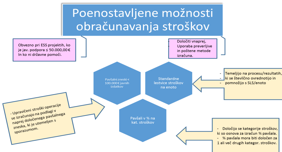
Slika 1: Prikaz poenostavljenih možnosti obračunavanja stroškov

Upravičeni stroški operacije so načeloma v obliki dejansko nastalih stroškov (vključno s prispevki v naravi in obračunom amortizacije). Možno pa je uporabiti tri poenostavljene oblike obračunavanja stroškov, kot jih prikazuje spodnja slika. Uporaba ene izmed poenostavljenih oblik je obvezna pri operacijah, ki so financirane iz sredstev ESS in ko je javna podpora operacije ≤ 50.000,00 € in ko operacija ni predmet državnih pomoči. Poenostavljene oblike obračuna upravičenih stroškov operacije je potrebno določiti vnaprej in pri tem uporabiti preverljivo in pošteno metodo izračuna.